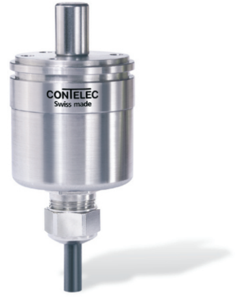
Vert-X 37 - 5V / PWM 订购代码